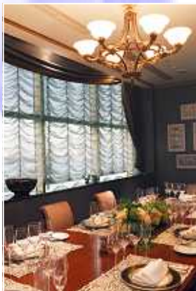
プライベートダイニング「La Mer」 (6~10名様まで)