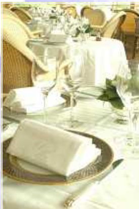
テーブルセット例