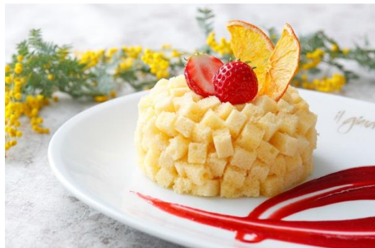
▲黄色いふわふわとしたミモザの花をイメージしたケーキ

店舗 イタリアンレストラン「イル・ジャルディーノ」 期間 2018年3月1日～3月14日 価格 メインチョイスコース＊ 2名様 18,000円(税金・サービス料込) ＊下記より、魚料理・肉料理のどちらか1品をお選びいただけます フルコース 2名様 20,000円(税金・サービス料込) メニュー グラススパークリングワイン 【前菜】 貝のプリマヴェーラ 【パスタ】 ほうれん草とリコッタチーズのパンツェロツェイ オックステールのラグー添え 【魚料理】鯛のグリエ サルモリツリオソース 【肉料理】牛フィレのタリアータ パルサミソース 【デザート】 コーヒー ・ パン