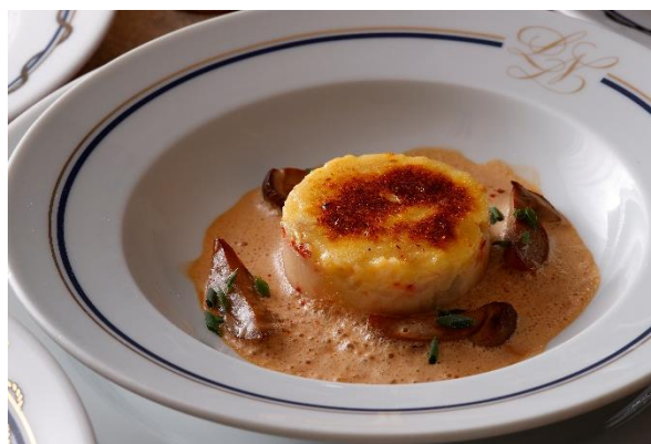
オマールブルーのパルマンティエール風グラタン 軽いナンチュアソース (ディナー・魚料理)