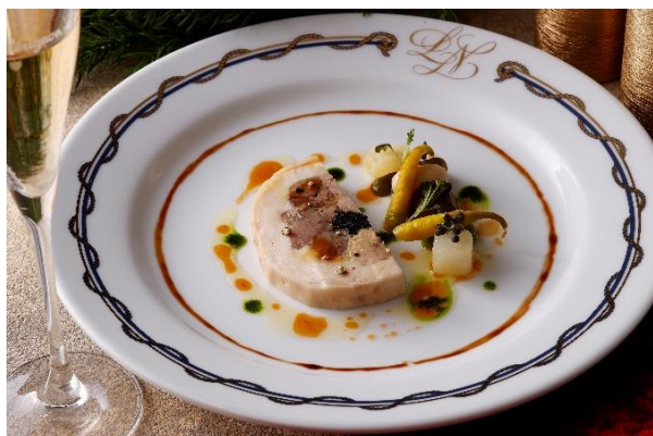
ブレス産パールドのバロティエヌ (ディナー・前菜)

伝統のフランス料理をクリスマスにふさわしい厳選した食材とアレンジで贈る特別なメニューをご用意しました。ディナーではキャビア、フォアグラ、トリュフの世界三大珍味をコースの随所にちりばめ、メインには海の最高級食材といわれるオマールブルーや国産牛フィレ肉をご堪能いただけます。ランチでは、メインディッシュを多彩なメニューよりお選びいただけるプリフィックスメニューをお楽しみいただけます。昼は横浜港の青い海と空、夜は宝石のように煌めく夜景、店内を彩るクリスマス装飾とともに、極上のメニューの数々をどうぞごゆっくりとお召し上がりください。