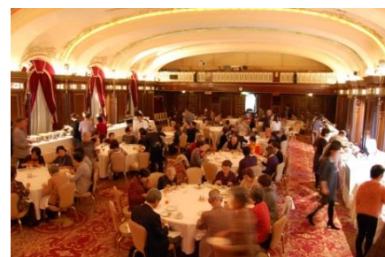
▲第1回横浜市民感謝 DAYの様子