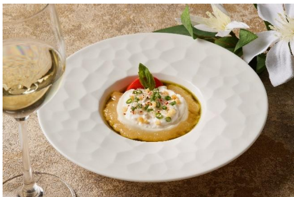
ブラッティーナ トマトミネラルのジュレ バジルペーストと共に