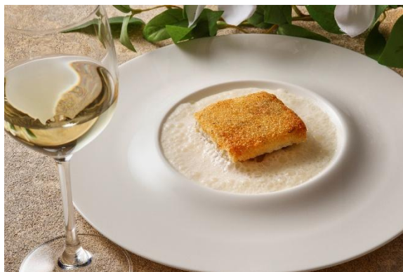
本日の白身魚 チーズのクルート アサリ風味の軽いバターソース