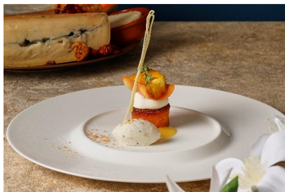
パイナップルのタルトとゴルゴンゾーラジェラート ココナッツの爽やかな香り